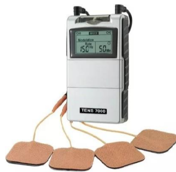
Figura 2. Imagen de TENS comerciales