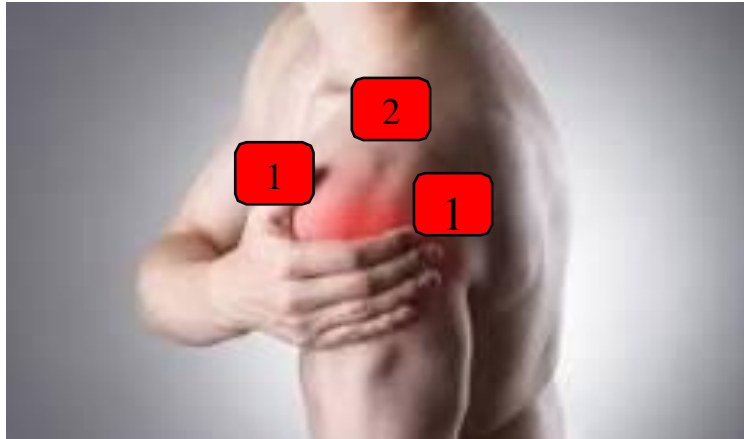
Figura 2. Posición de pads en ambos lados, y arriba y abajo del hombro.

En este caso se coloca un pad a cada lado del hombro y se trata durante 10 minutos; luego se repite colocando los pads arriba y abajo del hombro estimulando el mismo tiempo.