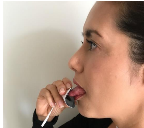
Figura 2. Tratamiento del estómago: Un pad en la lengua y el otro abajo del ombligo.